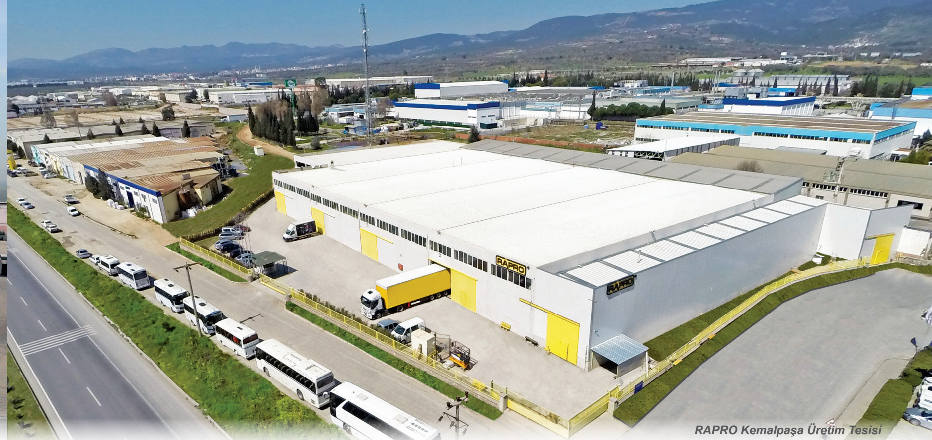
RAPRO Kemalpaşa Üretim Tesisi