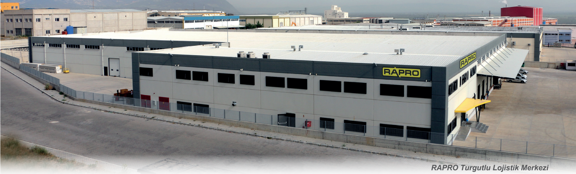
RAPRO Turgutlu Lojistik Merkezi